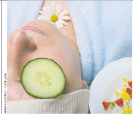
ADRIAN MOTOC - UNSPLEN