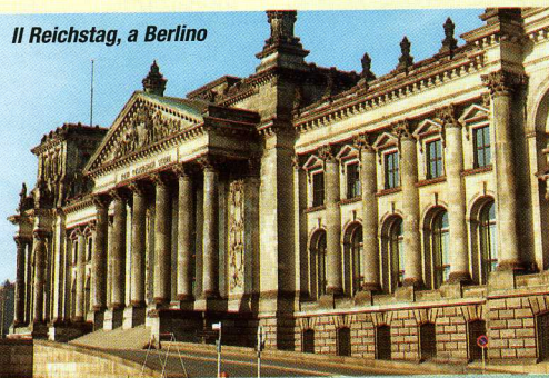
Il Reichstag, a Berlino