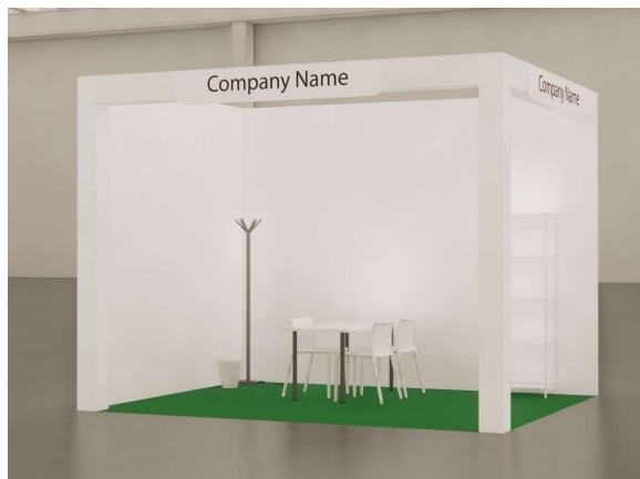
Vista | immagine indicativa - View | sample image