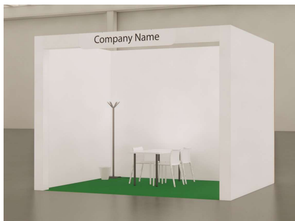
Vista | immagine indicativa - View | sample image

Maximum load allowed on each shelf 5kg * shelf fitted at 110,140,170 cm height. for any changes, contact Henoto15 days from the start of the event to the email address: sana.setup@henoto.com