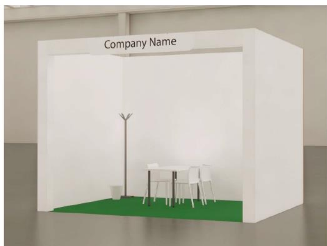
vista | immagine indicativa

Stand preallestiti Tamburato h300 verniciabile