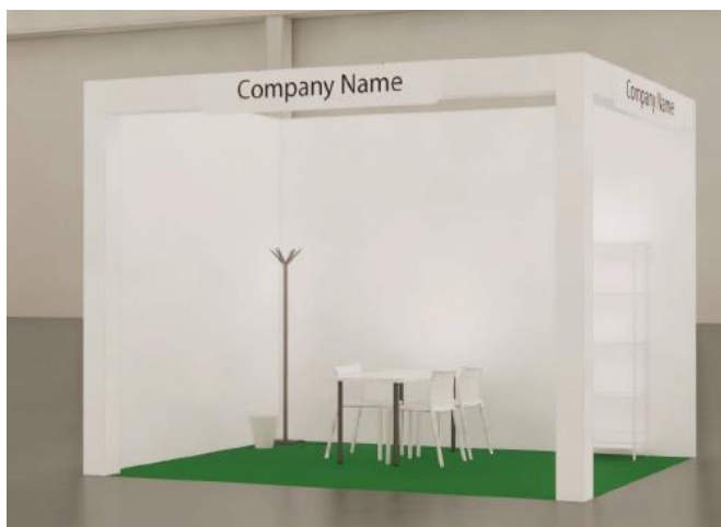
vista | immagine indicativa