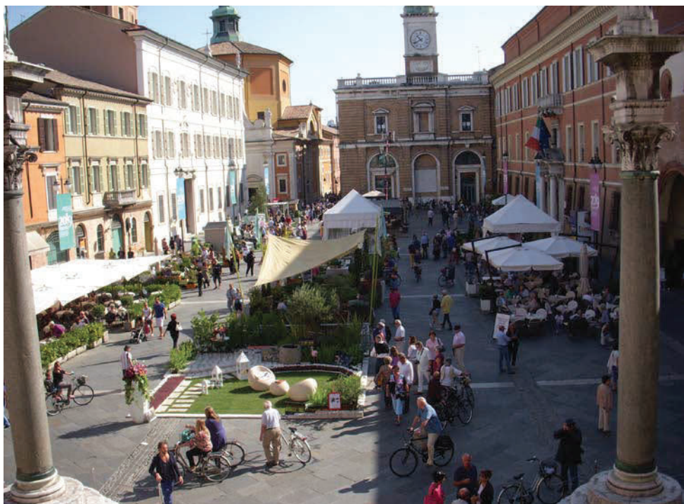
Verde Ravenna, 2-4 settembre

VERDE RAVENNA Ravenna 2-4 settembre IV edizione del Garden Show & Mostra Mercato che si tiene nel cuore della città, tra piazza del Popolo, piazza Garibaldi, piazza San Francesco, via Corrado Ricci e dintorni. La manifestazione consiste in una mostra-mercato, dedicata a piante, fiori, prodotti, macchine, attrezzature, tecnologie per il giardinaggio, sistemi di irrigazione ed anche arredo casa, artigianato artistico e antiquariato. www.giardinieterrazzi.eu