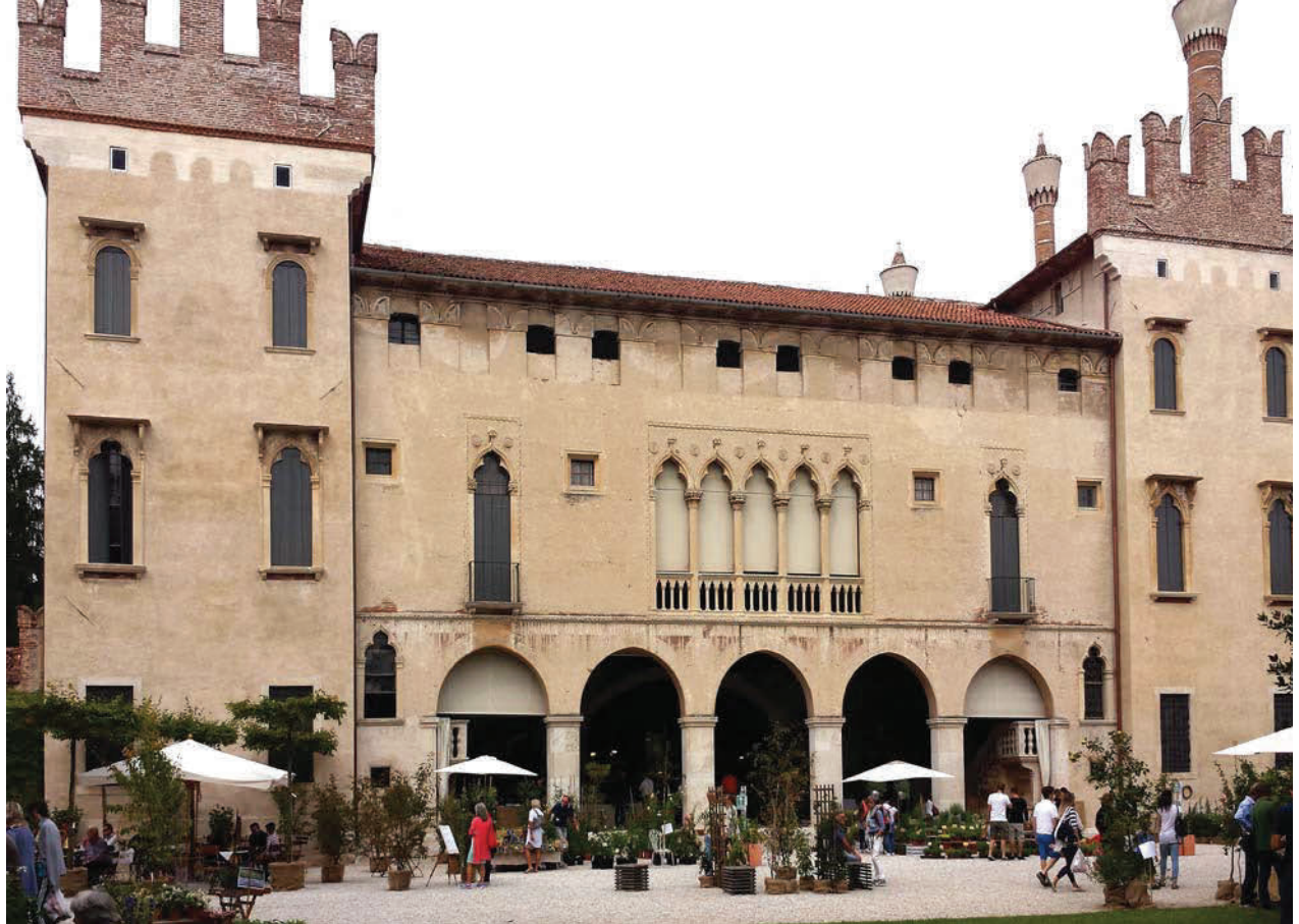
Castello di Thiene e momenti di Virdialia

SANA Bologna 9-12 settembre La vetrina internazionale del biologico italiano si trasferisce per l'occasione ai padiglioni 25, 26, 29, 30 e 36 del quartiere fieristico di Bologna. All'interno della nuova area espositiva troveranno spazio i tre settori cardine della manifestazione: Alimentazione biologica, con tutto l'universo food, Cura del corpo naturale e bio che includerà la sezione della salute e del benessere della persona e Green lifestyle, ovvero il settore dedicato a chi interessa uno stile di vita ecologico, sano e responsabile. Esporranno in fiera produttori e distributori di alimenti biologici, aziende di servizi e realtà che propongono attrezzature, packaging e tecnologie per l'apicoltura e l'agricoltura biologiche, ma anche enti di certificazione e istituzioni del settore. Figureranno tra le merceologie dell'area personal care trattamenti naturali, piante officinali e derivati, prodotti dietetici, integratori e alimenti speciali a base naturale, prodotti, servizi, accessori e attrezzature per la cura della persona. Nel comparto Green lifestyle si potrà scoprire un'ampia gamma di prodotti a ridotto impatto ambientale per la cura, l'arredamento e la bellezza della casa, oltre che per l'abbigliamento, il tempo libero e il "vivere verde" in generale. www.sana.it