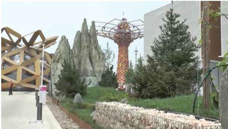
Il Biodiversity Park a Expo

A Expo il Biodiversity Park raccoglie oltre 3000 piante, una mostra e un Biomarket per far conoscere ai visitatori la grande ricchezza naturale dell'Italia