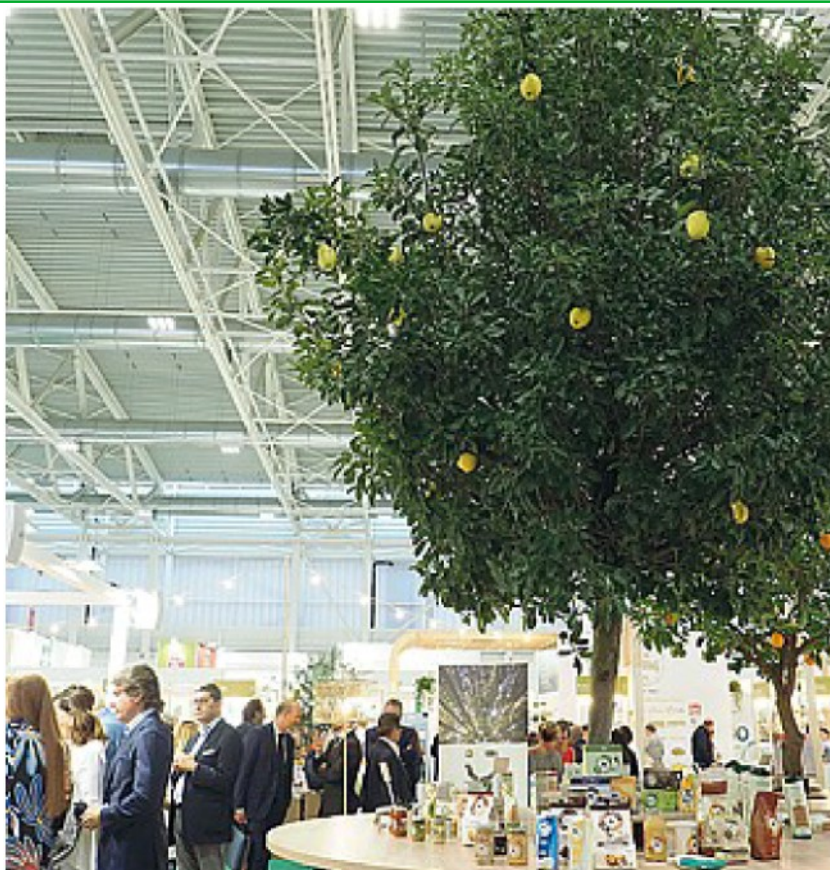
Tra gli stand Un'edizione passata di Sana, salone internazionale del biologico e del naturale