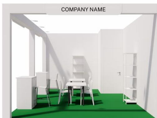
vista | immagine indicativa