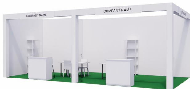
vista | immagine indicativa